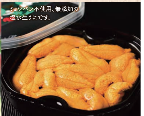
ミョウバン不使用、無添加の 塩水生うにです。