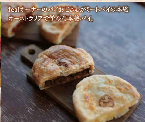
fealオーナーのパイおじさんがミートパイの本場 オーストラリアで学んだ本格パイ。