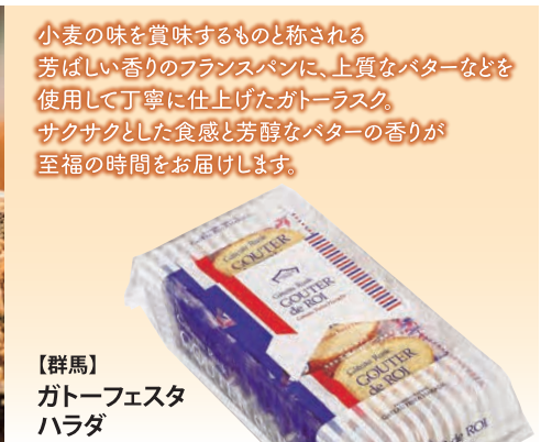
小麦の味を賞味するものと称される 芳ばしい香りのフランスパンに、上質なバターなどを 使用して丁寧に仕上げたガトーラスク。 サクサクとした食感と芳醇なバターの香りが 至福の時間をお届けします。