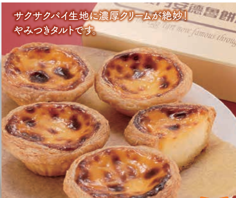
サクサクパイ生地に濃厚クリームが絶妙! やみつきたルトです。