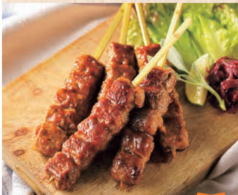
【北海道】トヨニシファーム 実演 豊西牛カルビ串(1本).....486円