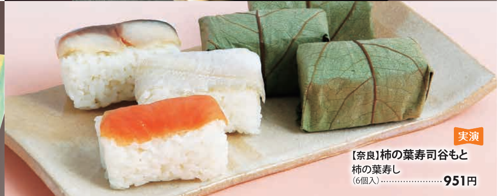
【奈良】柿の葉寿司谷もと 実演 柿の葉寿司 (6個入).....951円