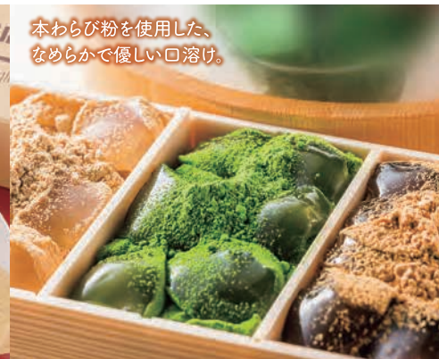
本わらび粉を使用した、 なめらかで優しい口溶け。