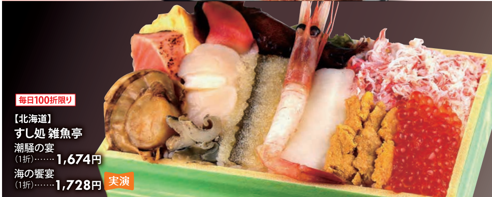
毎日100折限り 【北海道】 すし処 雑魚亭 潮騒の宴 (1折).....1,674円 海の饗宴 (1折).....1,728円 実演