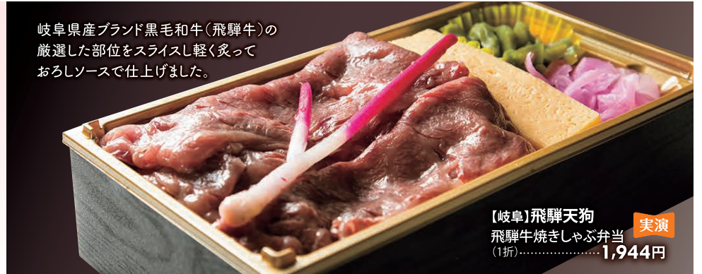
【岐阜】飛騨天狗 実演 飛騨牛焼きしゃぶ弁当 (1折).....1,944円