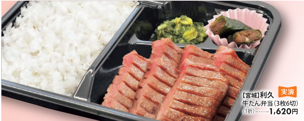
【宮城】利久 実演 牛たん弁当(3枚6切) (1折).....1,620円

金 Tamaya SAGA 〒840-8580 佐賀市中の小路2-5 ☎(0952)24-1151 営業時間/午前10時～午後6時30分