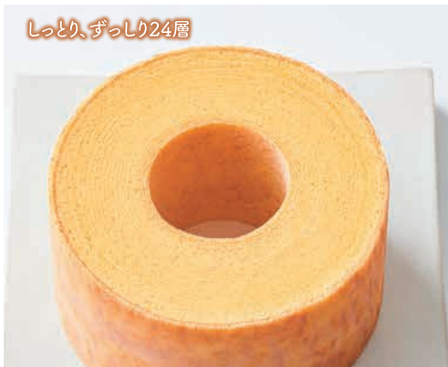
しっとり、ずっしり24層