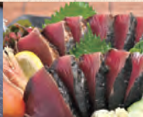
【高知】土佐しまんと本舗 鯉葉焼きたたき(1本).....1,836円