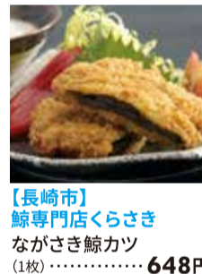
【長崎市】 鯨専門店くらさき ながさき鯨カツ (1枚)・・・648円