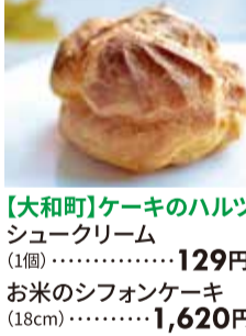
【大和町】ケーキのハルツ シュークリーム (1個)・・・129円 お米のシフォンケーキ (18cm)・・・1,620円