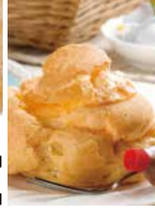
【武雄市】café・菓子 まんまる実柑 完熟メロンのケーキ(1個) 600円 とろける和三盆プリン (1個80g)・・・250円