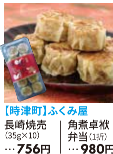
【時津町】ふくみ屋 長崎焼売 (35g×10)・・・756円