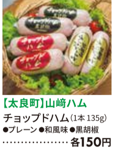
【太良町】山崎ハム チョップドハム(1本135g) ●ブレン ●和風味 ●黒胡椒 ・・・各150円