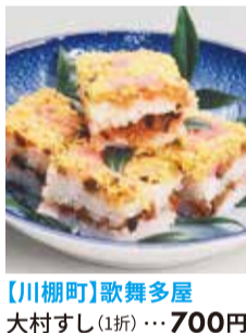
【川棚町】歌舞多屋 大村すし(1折)・・・700円