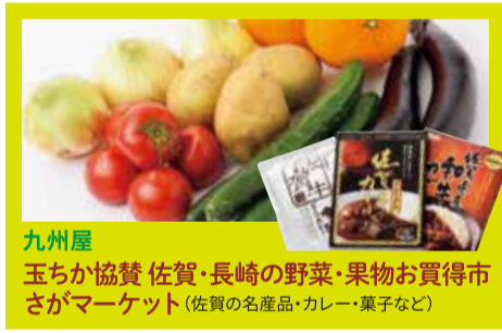
九州屋 玉ちか協賛 佐賀・長崎の野菜・果物お買得市 さがマーケット(佐賀の名産品・カレー・菓子など)