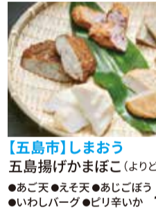
【五島市】しまおう 五島揚げかまぼこ(よりどり5枚) ●あご天 ●えそ天 ●あじごぼう ●いわしバーグ ●ピリ辛いか 1,080円