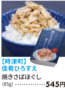
【時津町】 住肴ひろすえ 焼きさばほぐし (85g)・・・545円