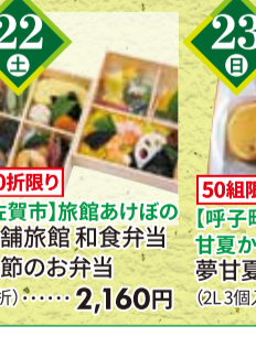
日替りお取り寄せ ※写真はイメージです。