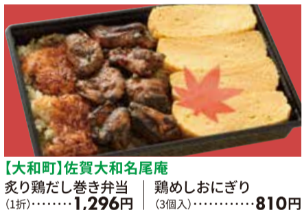
【大和町】佐賀大和名尾庵 炙り鶏だし巻き弁当 (1折)・・・1,296円