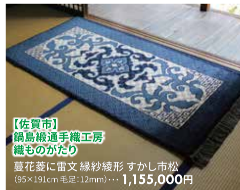
【佐賀市】 鍋島織通手織工房 織ものがたり

蔓花菱に雷文 緑紗綾形 すかし市松 (95×191cm 毛足:12mm)・・・1,155,000円