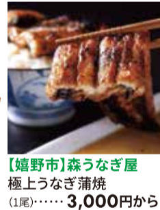
【嬉野市】森うなぎ屋 極上うなぎ蒲焼 (1尾)・・・3,000円から