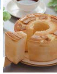
【長崎市】 i+Land nagasaki ヴィエノワズリー・ クロワッサン等パン各種 (よりどり5個)・・・1,000円