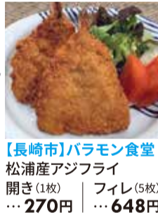
【長崎市】バラモン食堂 松浦産アジフライ 開き(1枚)・・・270円 フィレ(5枚)・・・648円