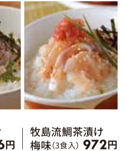
牧島流鯛茶漬け 梅味(3食入) 972円