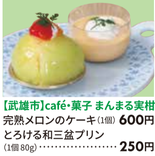
【鳥栖市】 おかしの水田屋 ふくらすずめ最中 (1個65g)・・・220円