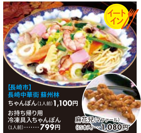
【長崎市】 長崎中華街 蘇州林 ちゃんぽん(1人前) 1,100円 お持ち帰り用 冷凍具入ちゃんぽん (1人前)・・・799円