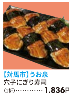
【対馬市】うお泉 穴子にぎり寿司 (1折)・・・1,836円