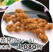
【麻花兒(マフアール)】 (15本入)・・・1,030円