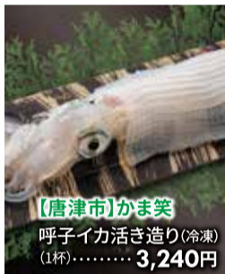
【唐津市】かま笑 呼びイカ活き造り(冷凍) (1杯)・・・3,240円