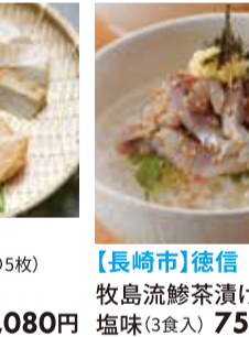
【長崎市】徳信 牧島流鯨茶漬け 塩味(3食入) 756円