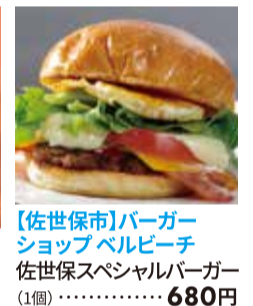
【佐世保市】バーガー ショップベルビーチ 佐世保スペシャルバーガー (1個)・・・680円